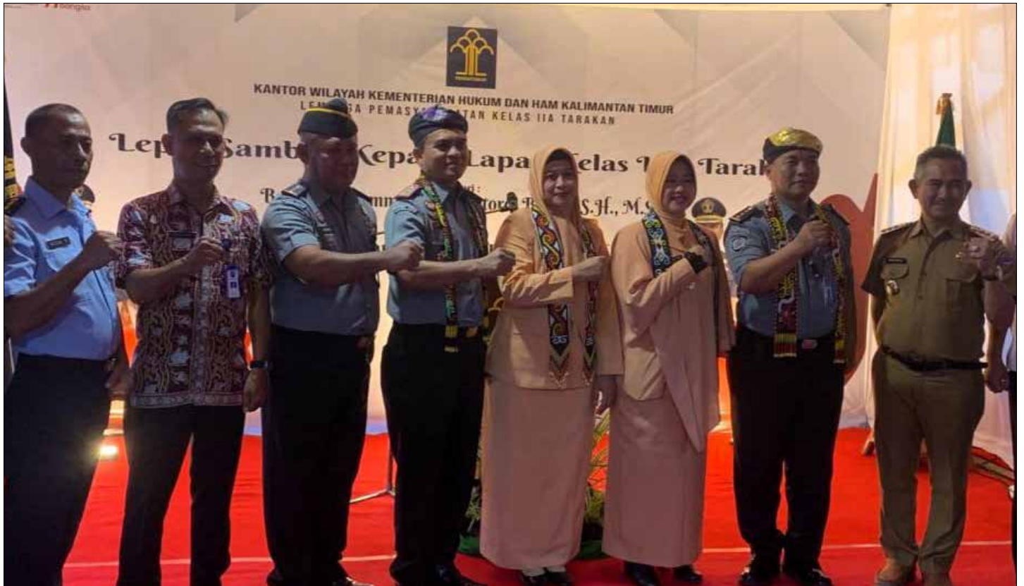
Lepas Sambut Kepala Lapas Kelas IIA Tarakan.