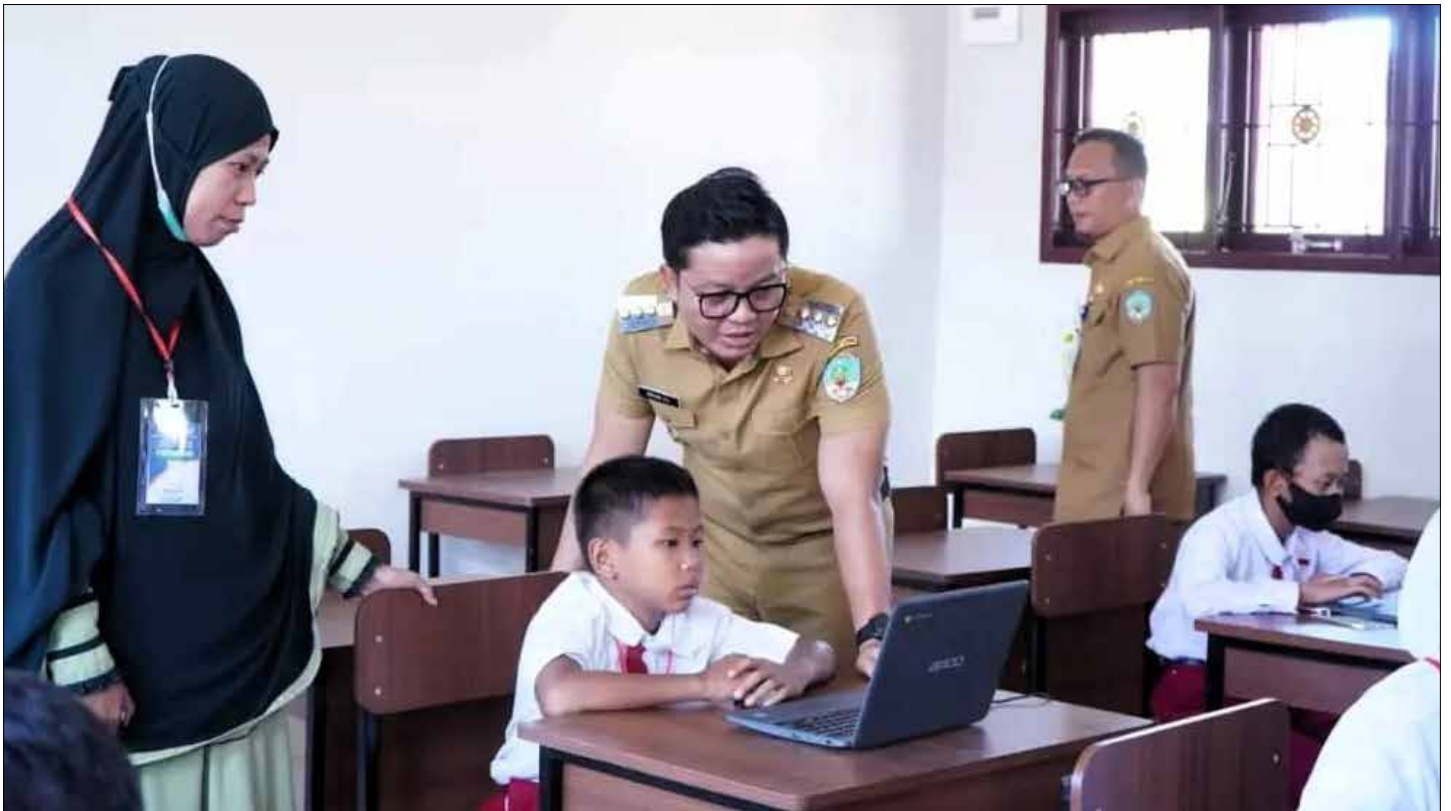
Bupati KTT Ibrahim Ali saat melakukan monitoring pada salah satu lembaga pendidikan di KTT.