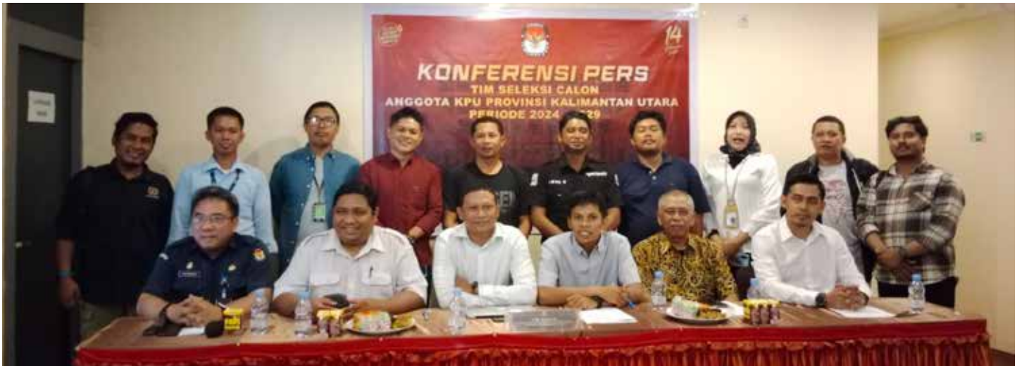
Timsel calon anggota KPU Kaltara, saat mensosialisasikan tahapan dan pendaftaran calon anggota KPU Kaltara.