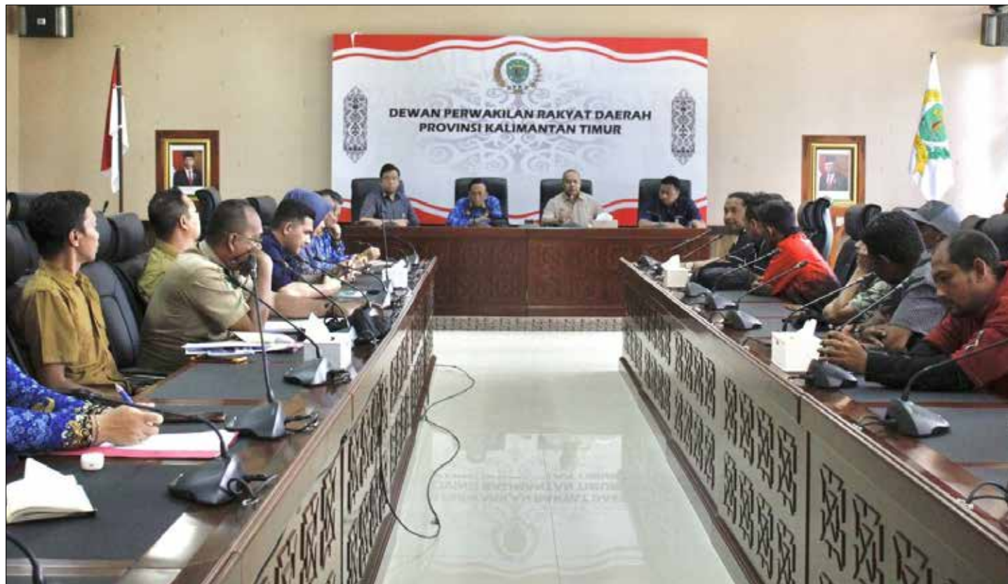
RDP Komisi IV DPRD Kaltim.