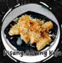
Pisang Goreng Kaya