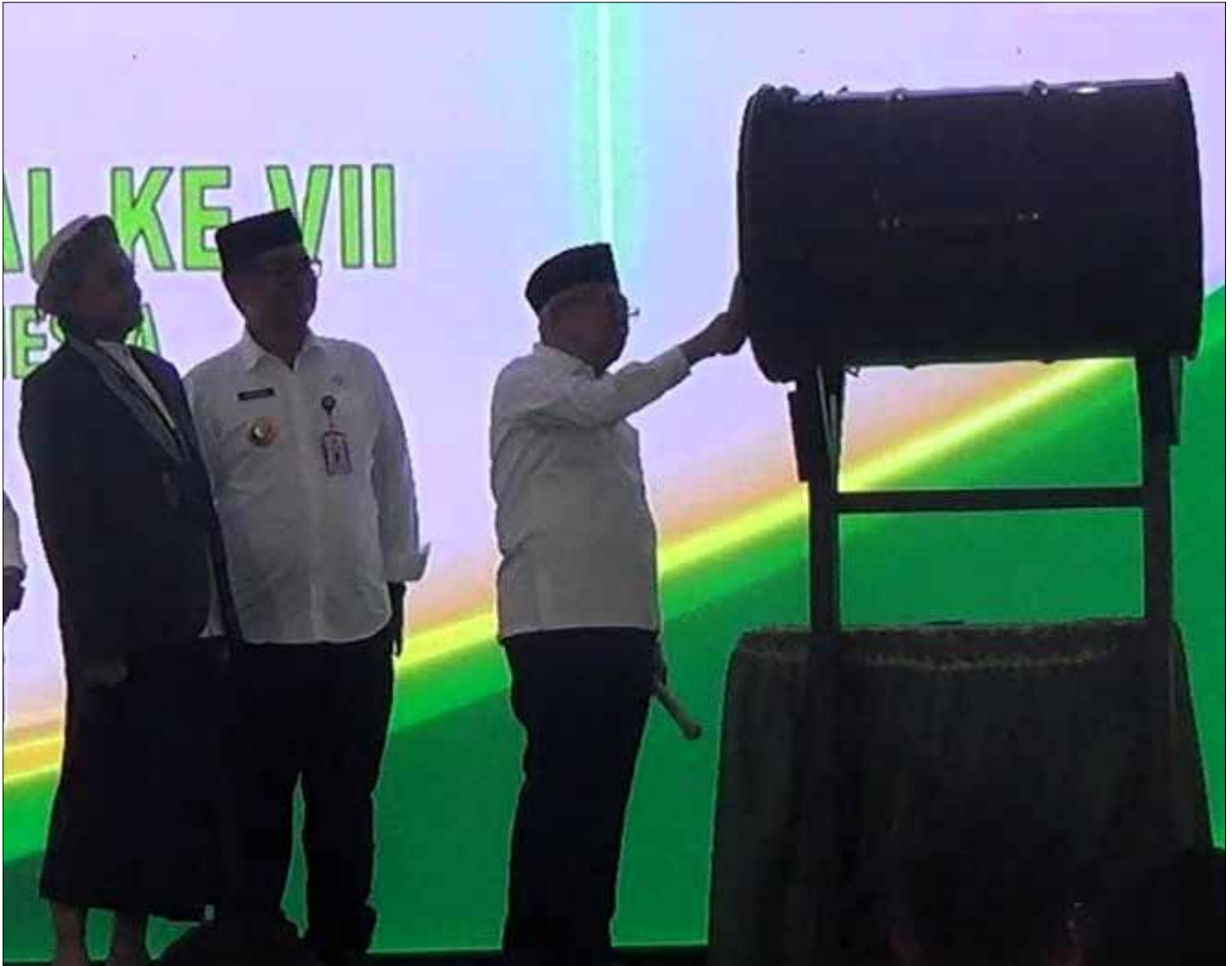
Wakil Presiden RI, Ma'ruf Amin saat membuka Silaturahmi Nasional (Silatnas) ke-VII Kontak Santri Agribisnis Indonesia (Konsain) di Pondok Pesantren Syaichona Cholil, Selasa (24/10).