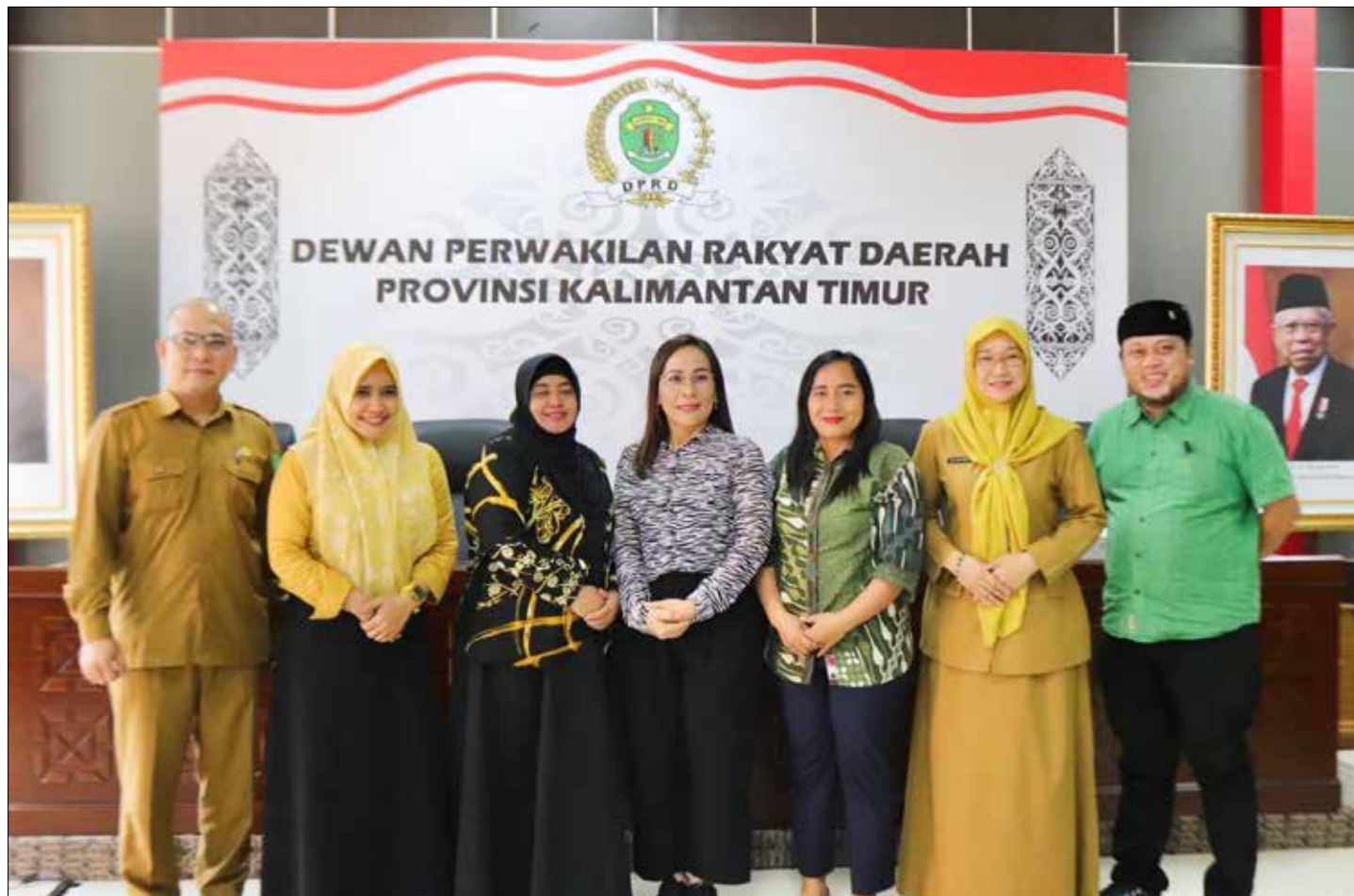
Kunjungan Pansus DPRD Kutai Kartanegara ke DPRD Provinsi Kaltim