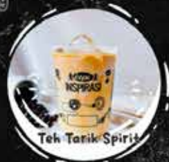
Teh Tarik Spirit