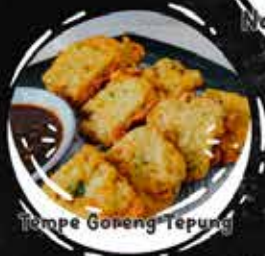
Tempe Goreng Tepung