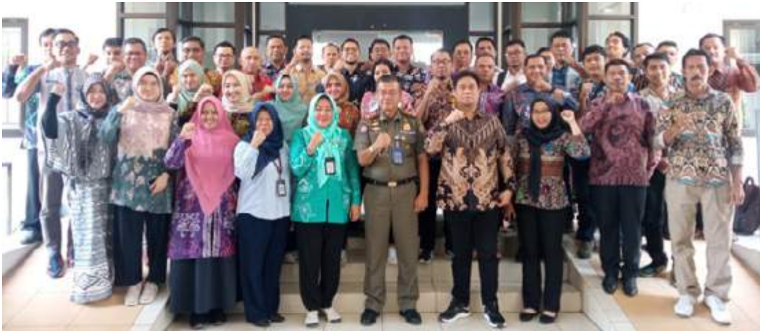
Rangkaian Kegiatan Benchmarking di Yogyakarta