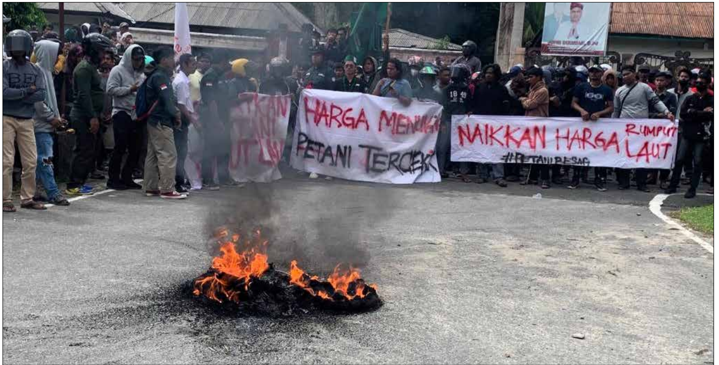
Suasana demo di depan gedung DPRD Tarakan.