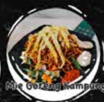
Mie Goreng Kampung