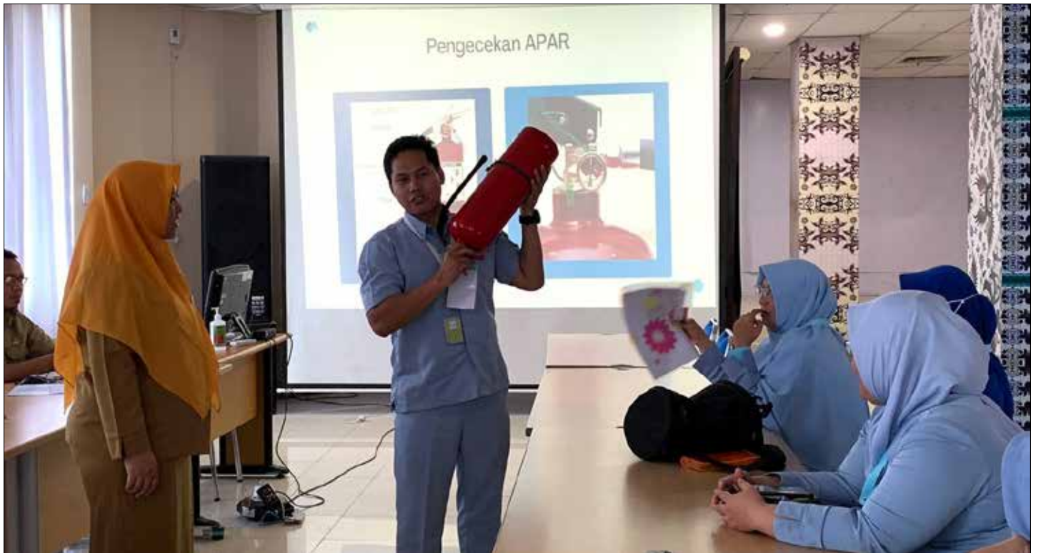
Kegiatan penerimaan praktek profesi ners, saat pengisian materi di Ruang Aula Nusa Indah, RSUD Taman Husada Bontang.