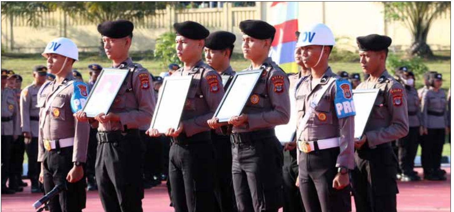
Personel Polda Kaltara, menunjukan foto personel yang diberikan sanksi PTDH.