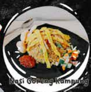
Nasi Goreng Kampung