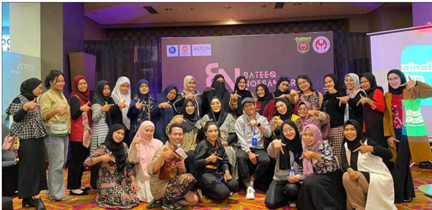
Kegiatan Bateeq Noesantara di Hotel Aston Samarinda