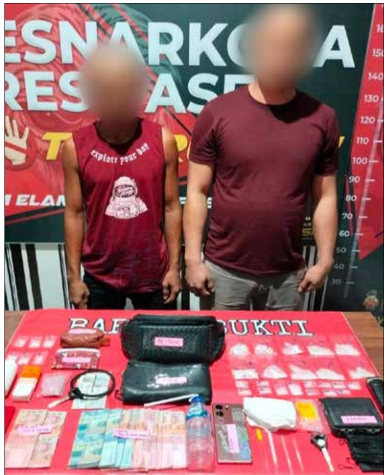
Tersangka dan barang bukti.

Pewarta : Bhakti Sihombing Editor : Nicha Ratnasari