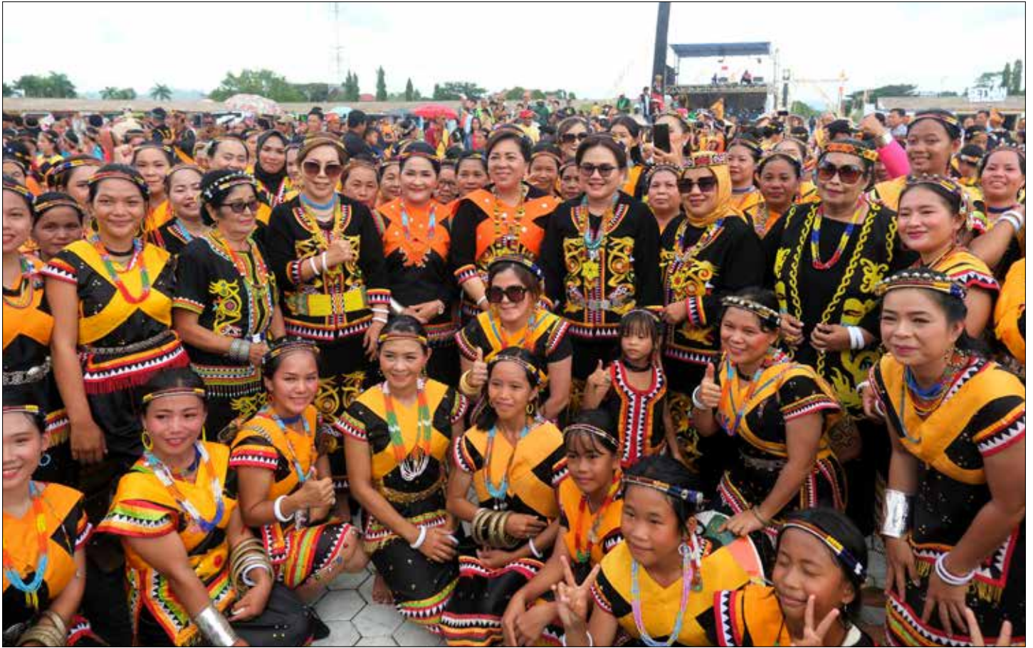
Ribuan penari adat Dayak Belusu ikut meriahkan hari kesenian saat perayaan HUT Kabupaten Malinau.