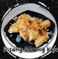
Pisang Goreng Kaya