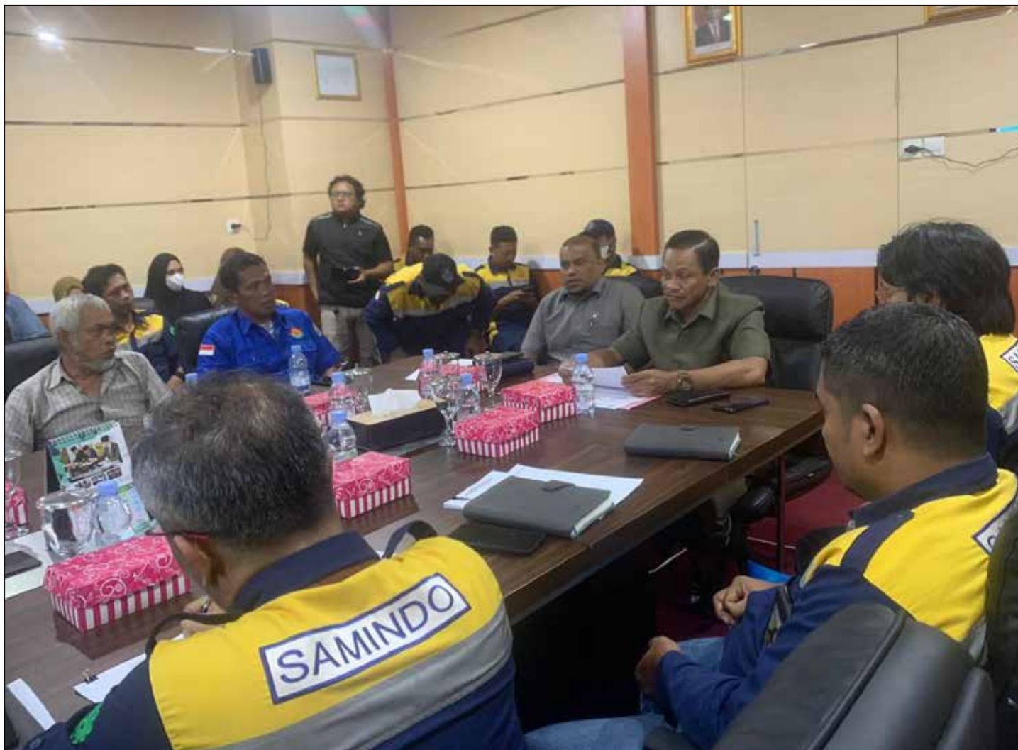
Mediasi di DPRD Kabupaten Paser.