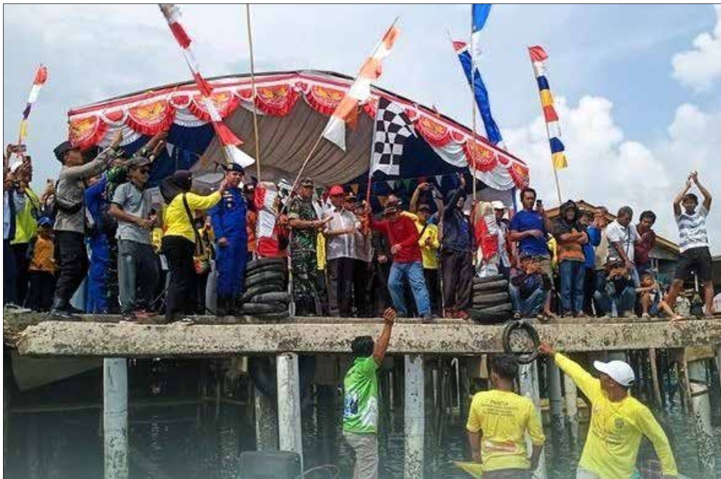
DISKOMINFO PPU FOR MEDIAKALTIMGROUP

Pembukaan Lomba Balap Kapal Dompeng 2023 di Kelurahan Jenebora, Minggu (22/10/2023).