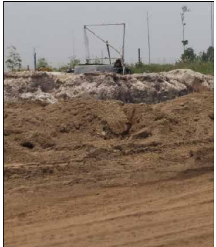
Aktivitas di lokasi pembangunan KIH Tanah Kuning-Mangkupadi, oleh pemerintah daerah, soal retribusi beberapa waktu lalu.