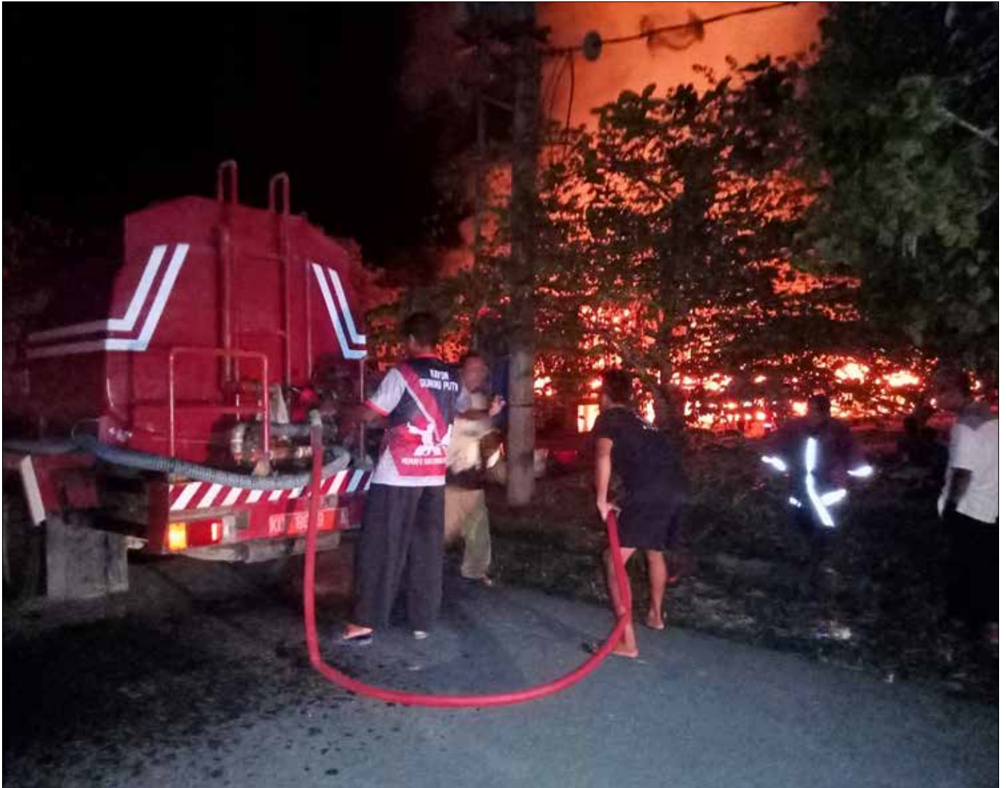
Satu unit rumah di Sekang Desa Antutan, Kecamatan Tanjung Palas ludes dilahap si jago merah.