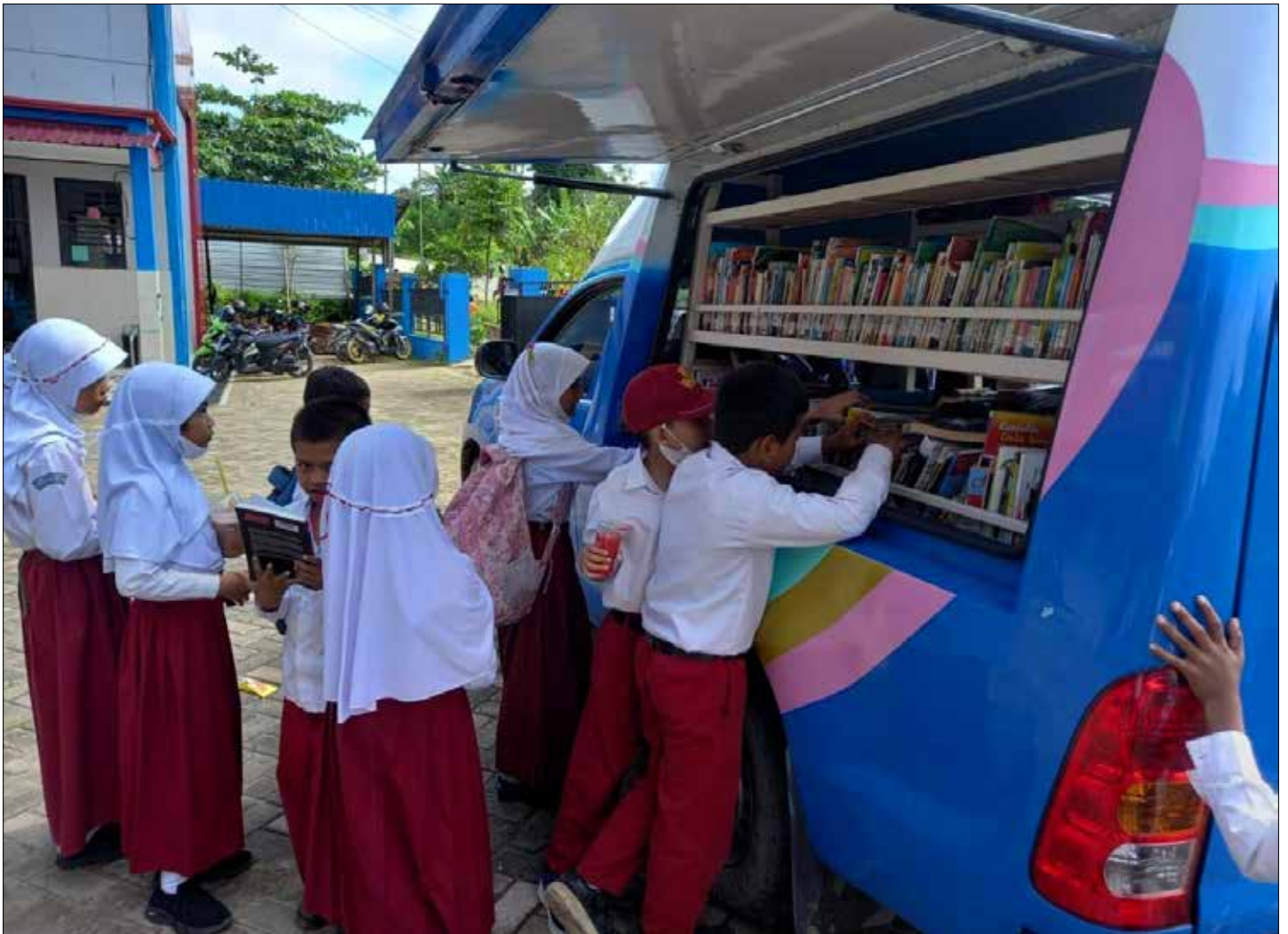
Mobil Layanan Perpustakaan Keliling berkunjung ke SD Negeri 017 Gunung Cermin, Kelurahan Sempaja Utara, Kecamatan Samarinda Utara.