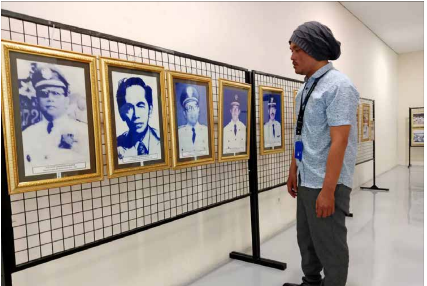
Salah seorang pengunjung saat melihat foto-foto bersejarah Kota Samarinda.