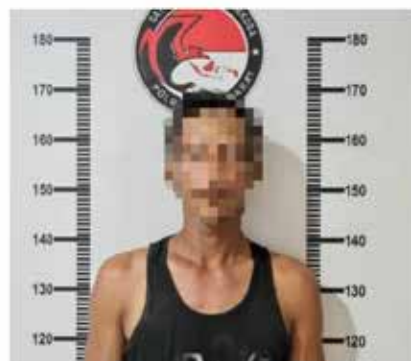
Tersangka D, HA, dan EY beserta barang bukti berupa sabu, HP, dan mobil.