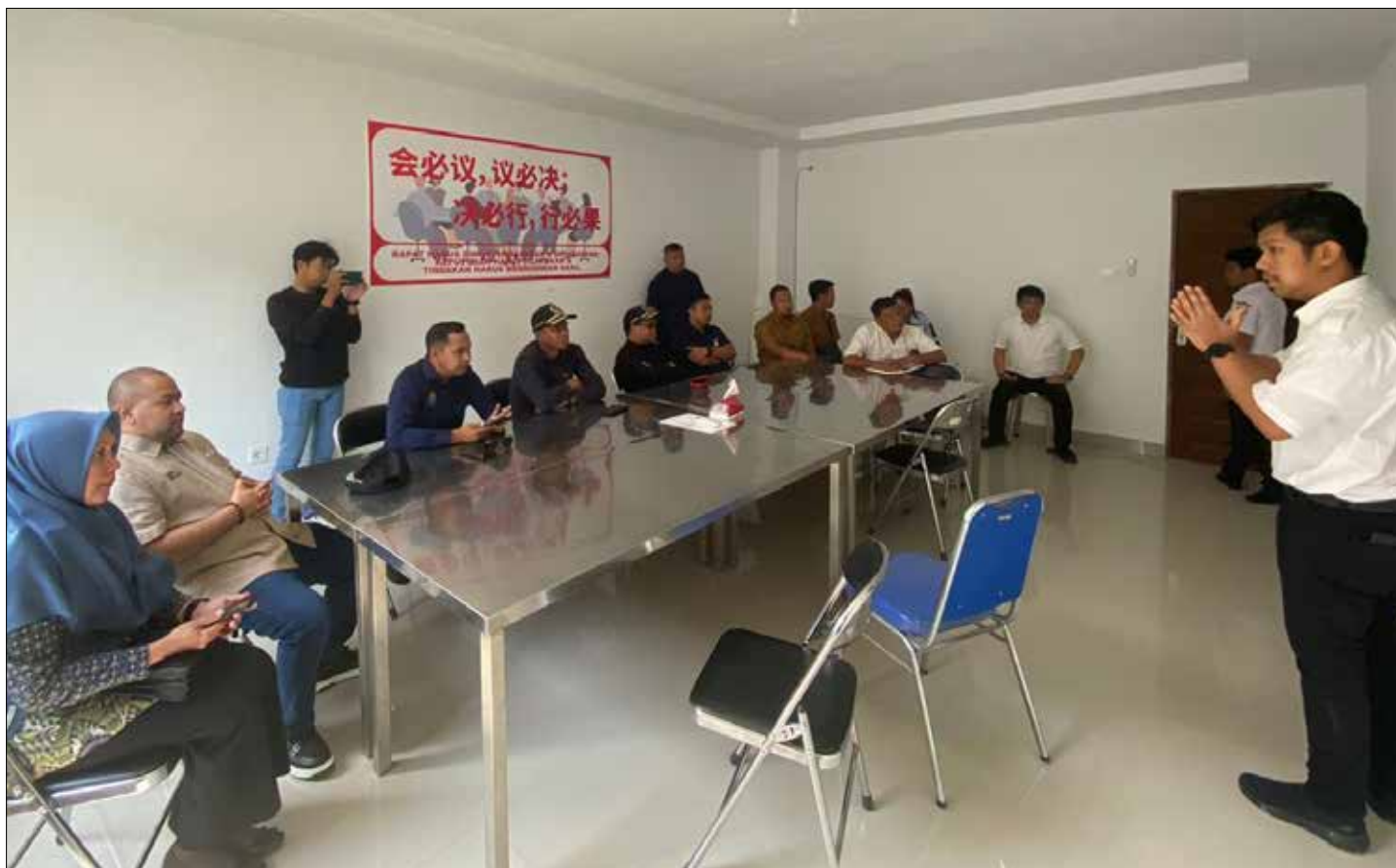
Kunjungan Komisi IV DPRD Kaltim, ke PT KFI.