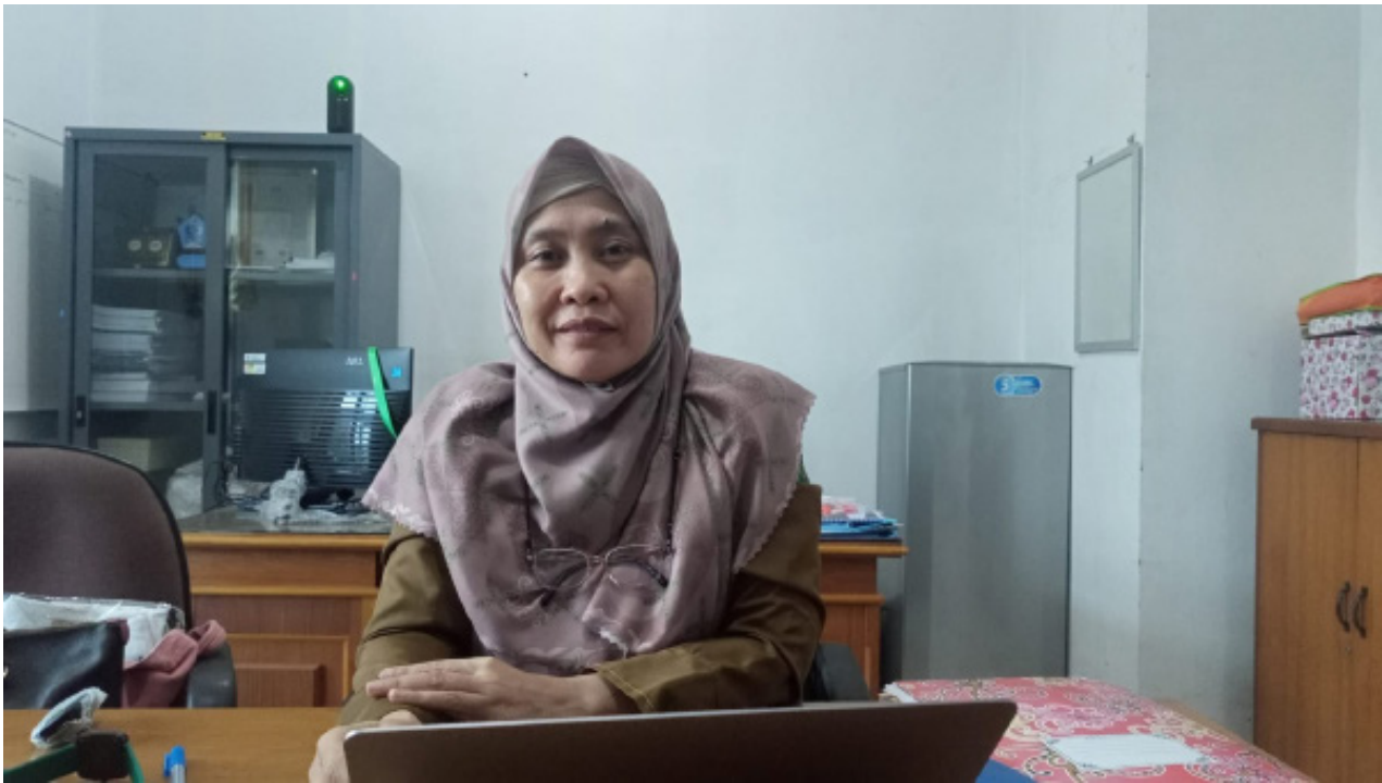
Rumah sakit Sepaku merupakan kesehatan untuk melayani pekerja yang ada di IKN.