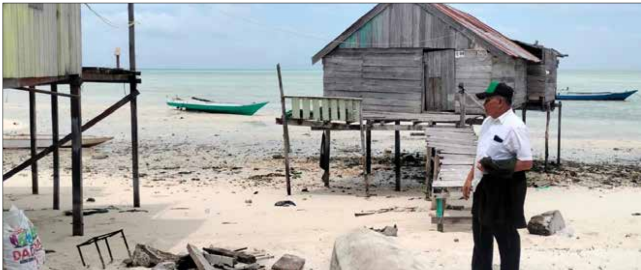
Ketua Komisi III DPRD Berau, Saga saat meninjau titik abrasi di Pulau Balikukup.