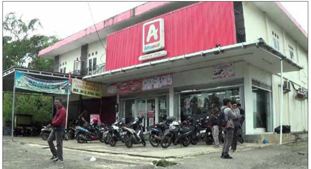
Minimarket Alfamidi Batuah, Balikpapan Utara, yang dirampok oleh dua orang pria dengan senjata tajam pada Rabu (18/10) sekitar pukul 22.30 WITA.

Selang beberapa menit, terdengar suara benda jatuh dari samping. Rupanya salah seorang pelaku nekat melompat dari lantai dua dan berhasil melarikan diri ke semak-se-