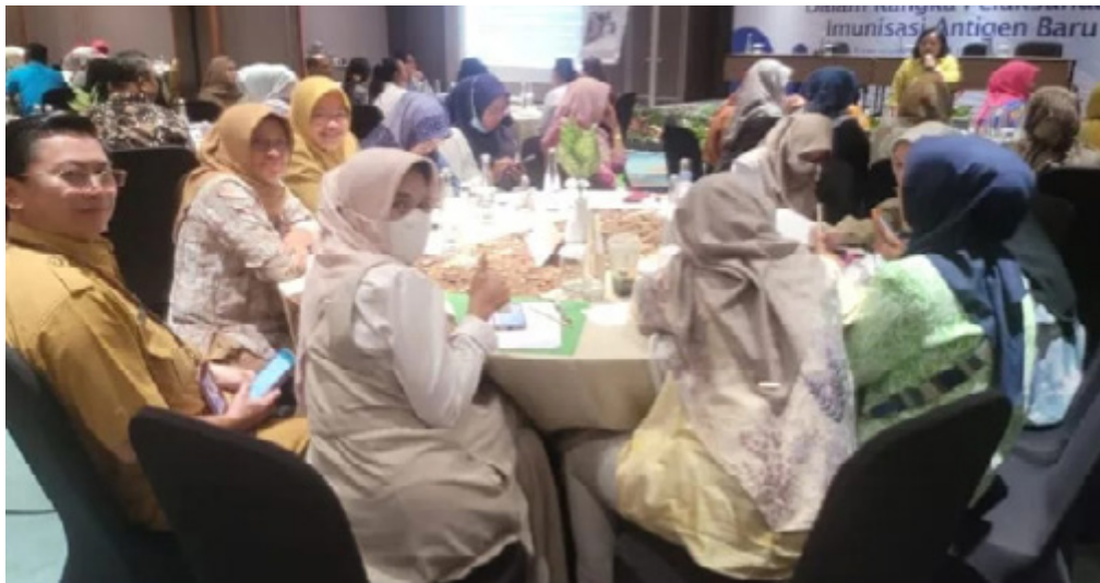
Dinkes galakkan penurunan stunting di Kaltim.