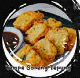
Tempe Goreng Tepung