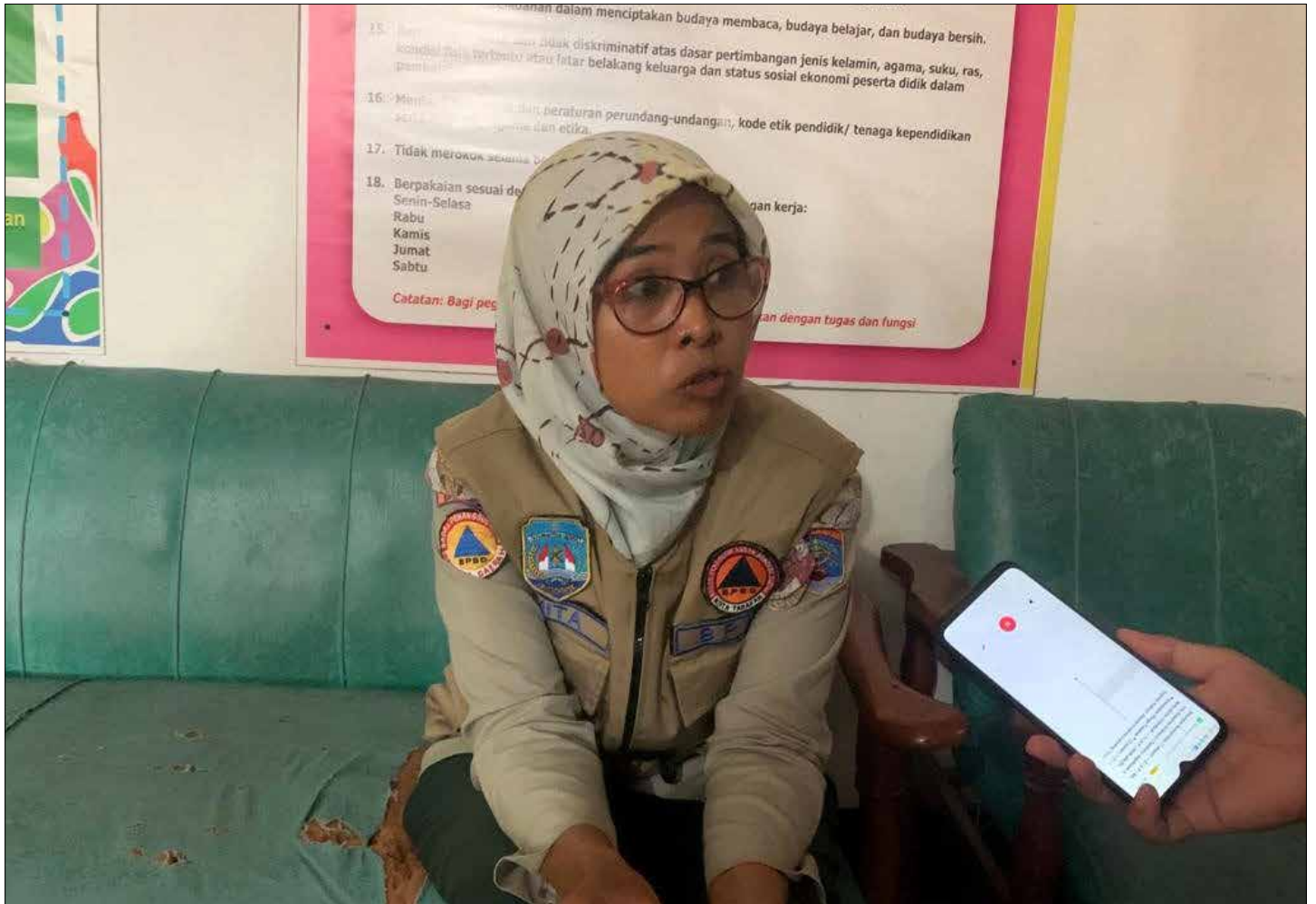
Kasi Kesiapsiagaan BPBD Tarakan, Paramita.