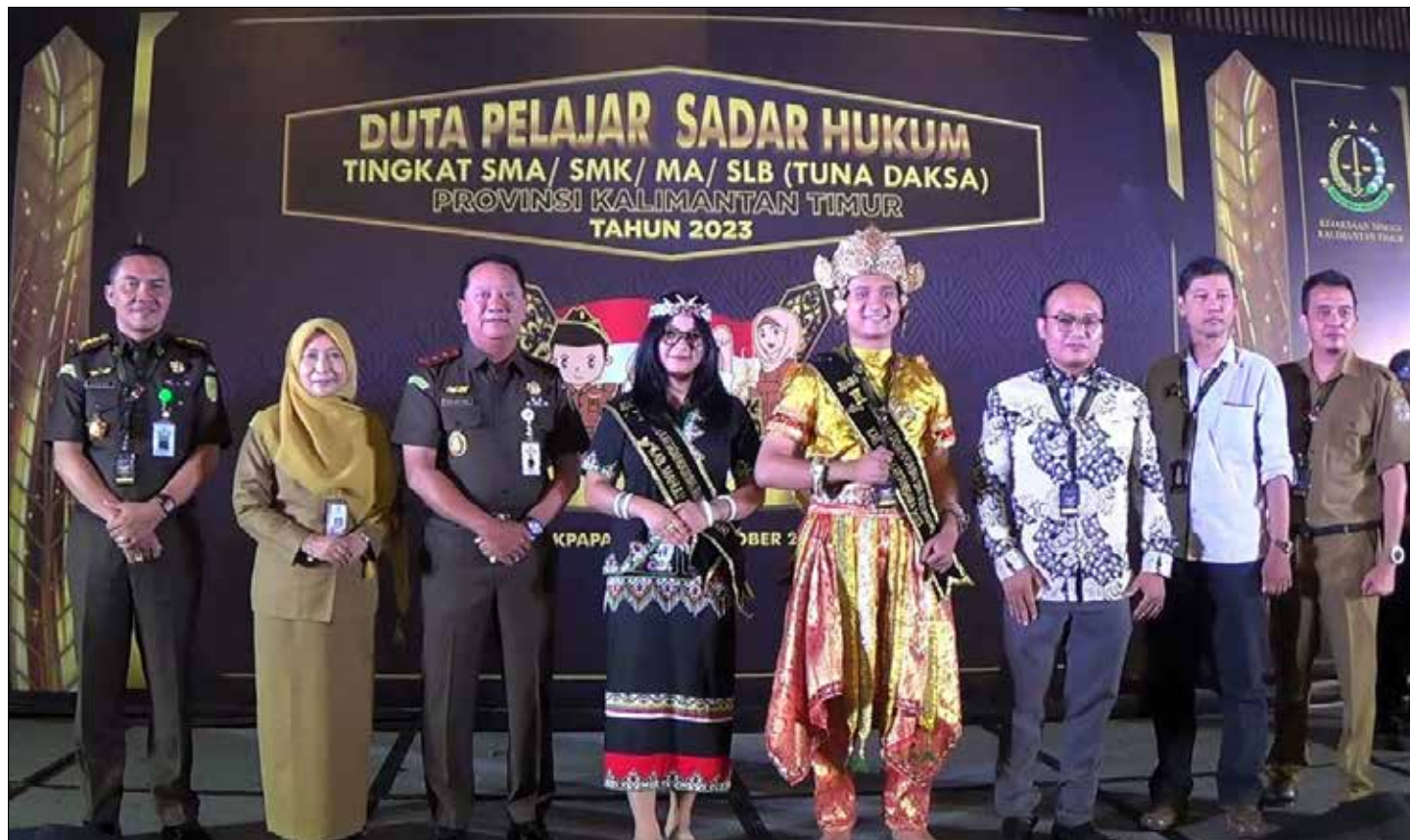
Kejati Kaltim, bersama Plh. Kadisdikbud Kaltim, berfoto bersama salah satu perwakilan Duta Pelajar Sadar Hukum Kaltim 2023.