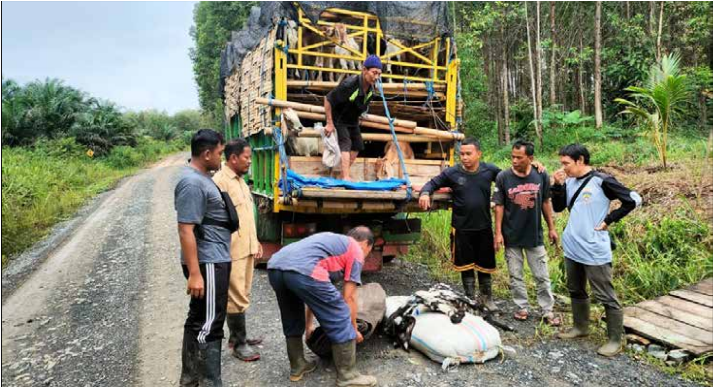
Selain Pengembangan pangan, pemerintah juga memfokuskan pengembangan ternak kambing dengan memperdayakan Petani Milenial.