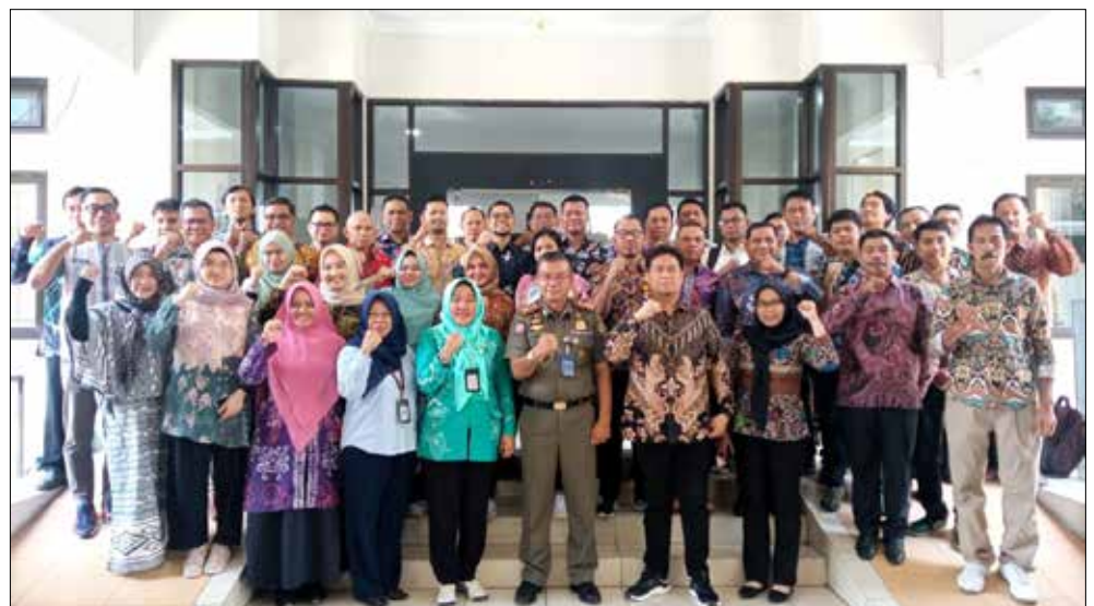
Rangkaian Kegiatan Benchmarking di Yogyakarta.