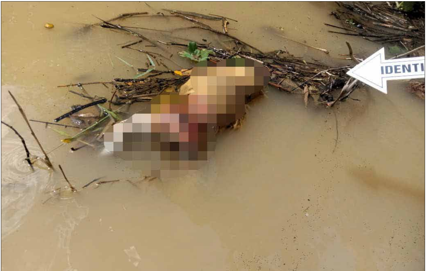
Mayat bayi perempuan terlihat mengapung di Sungai Buaya, identitas lengkap belum diketahui.