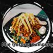
Mie Goreng Kampung