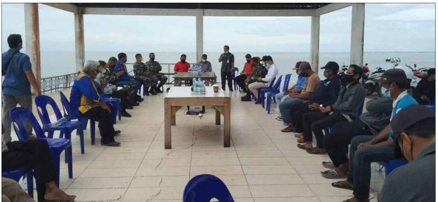
Sosialisasi oleh pemerintah daerah dengan melibatkan nelayan di Pulau Bunyu beberapa waktu lalu.

Reporter: Martinus Nampur Editor: Andhika