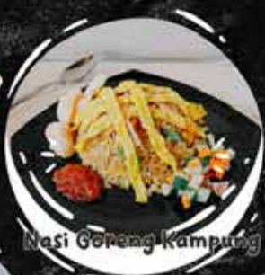
Nasi Goreng Kampung