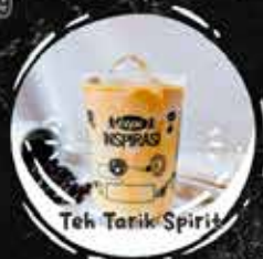
Teh Tarik Spirit