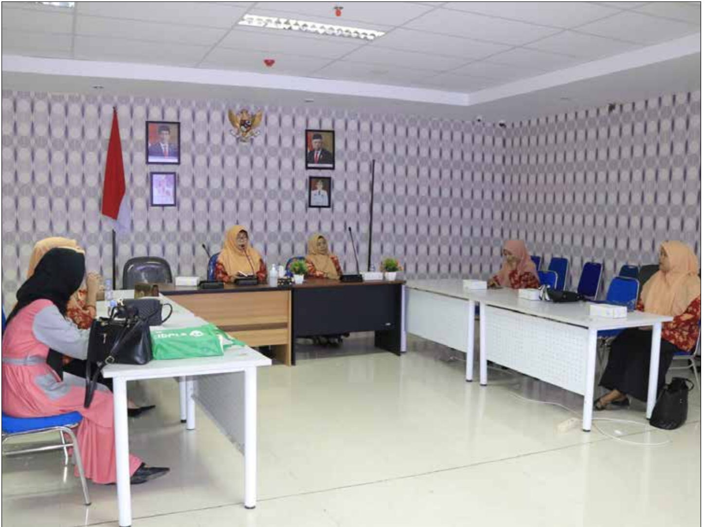
PERTEUMUAN: DWP DKISP Provinsi Kaltara menggelar pemahaman Konsep Dasar Gender, Jumat (8/8).