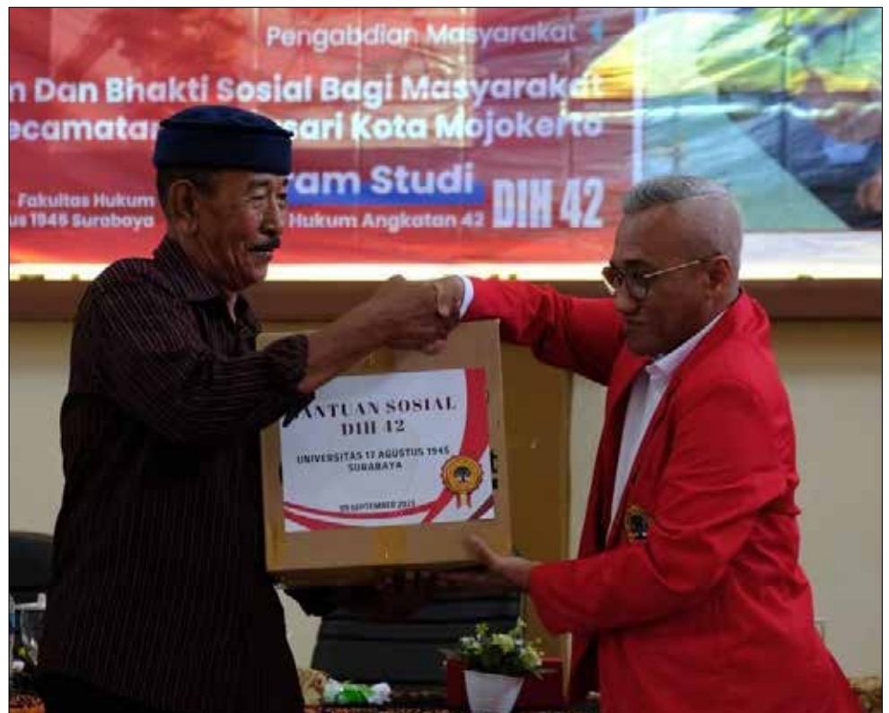
Mahasiswa prodi DIH Untag Surabaya saat menjalankan program pengabdian masyarakat.

"Semoga bantuan yang kami berikan dapat bermanfaat ke depannya," tandasnya. (and)