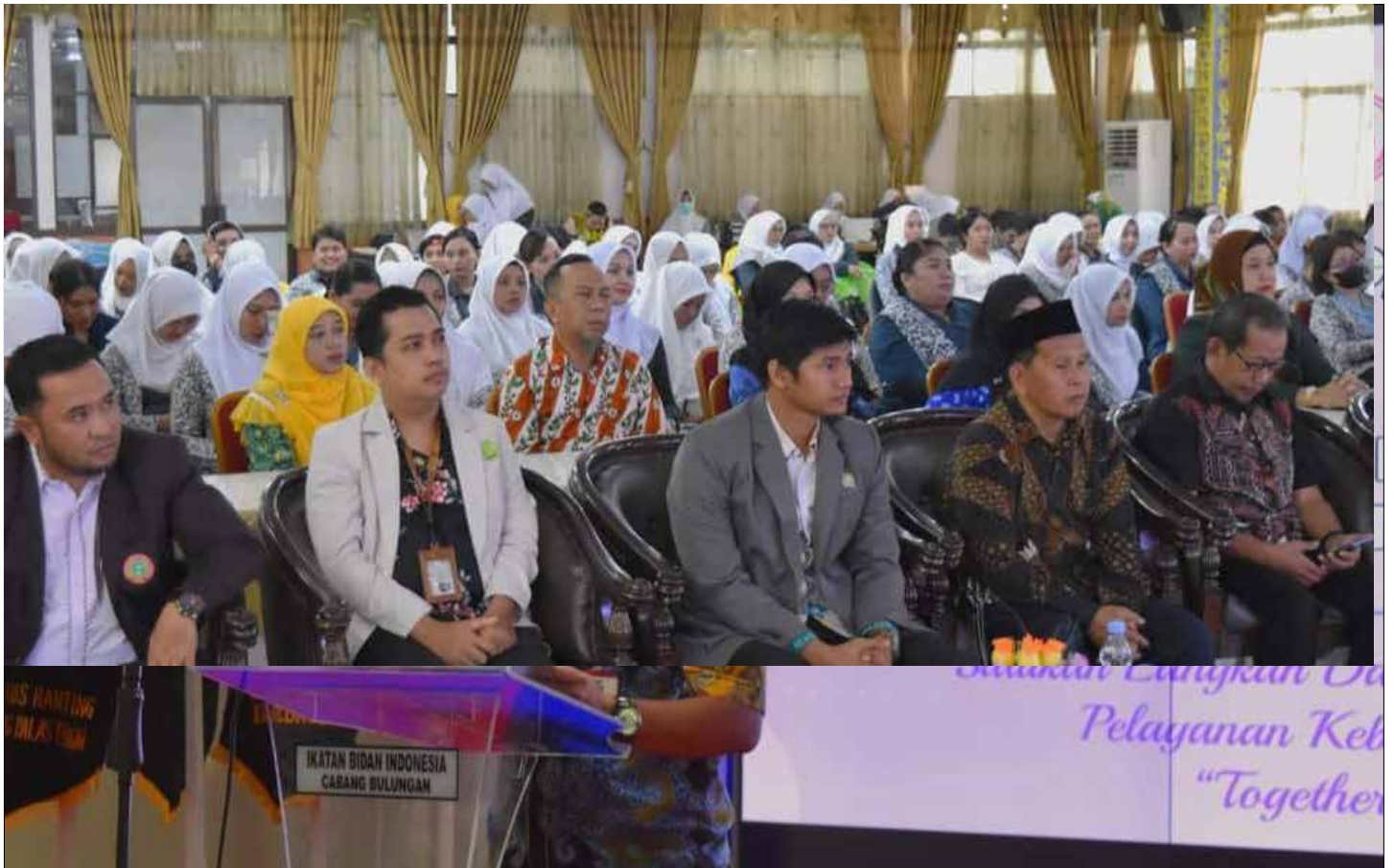
Rapat Kerja Cabang (Rakercab) Ikatan Bidan Indonesia Di Kabupaten Bulungan.