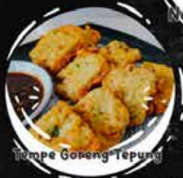
Tempe Goreng Tepung