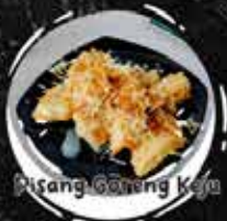
Pisang Goreng Kayu