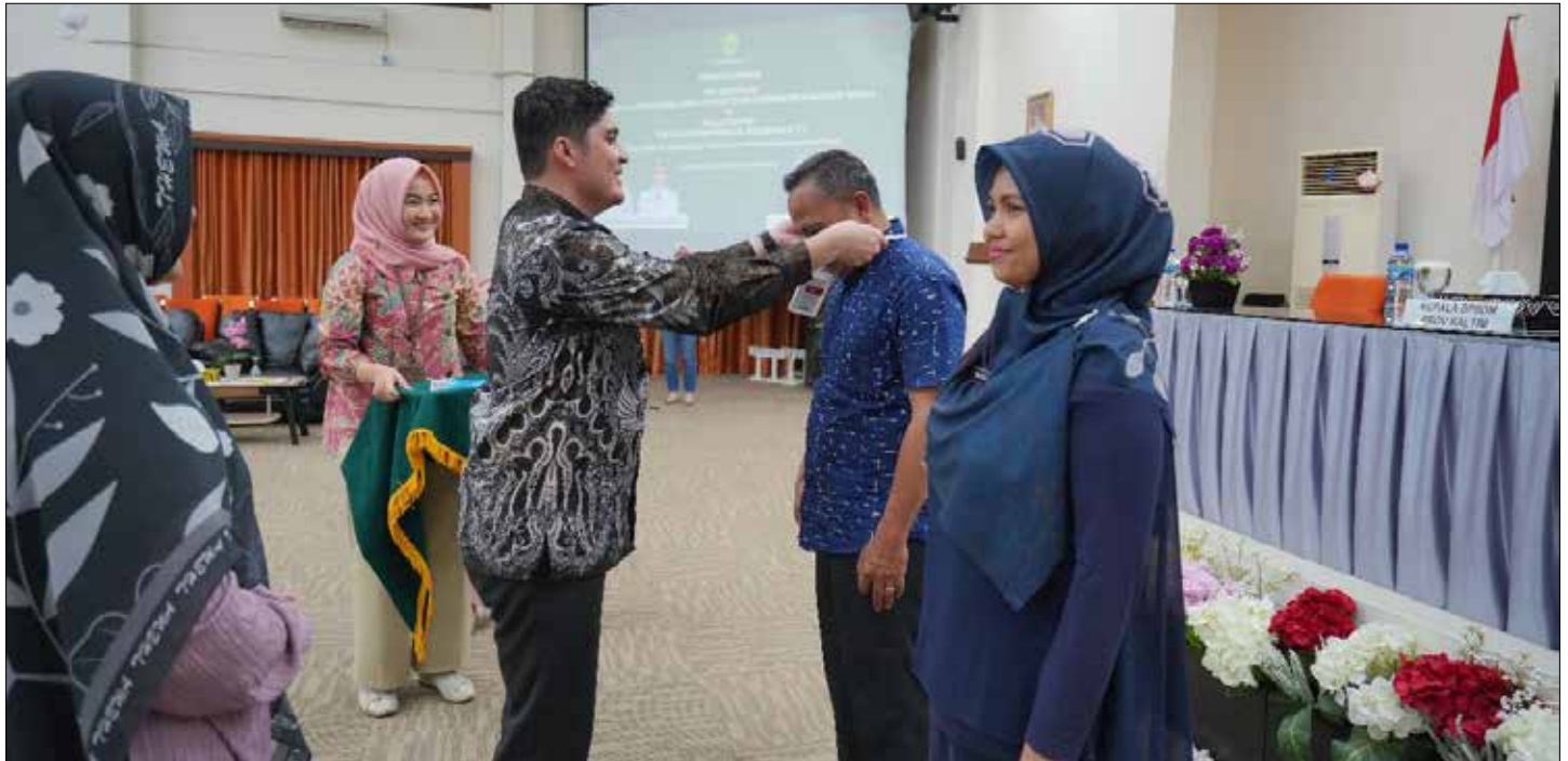
Rangkaian Kegiatan Penutupan Pelatihan Public Speaking and Effective Communication Skill & Pelatihan Pelayanan Publik Berbasis IT bagi ASN Kaltim.