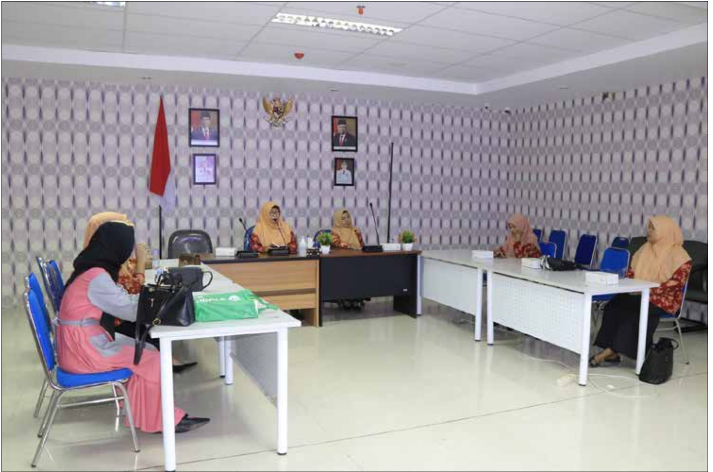
PERTEMUAN: DWP DKISP Provinsi Kaltara menggelar pemahaman Konsep Dasar Gender, Jumat (8/8).