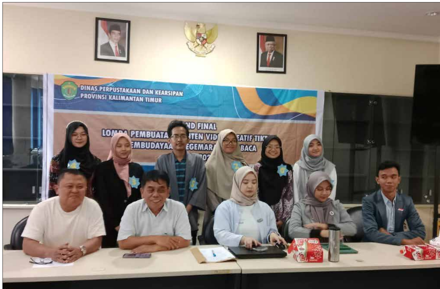
Sesi foto bersama Dewan Juri, Panitia dan Peserta Lomba Karya Video Kreatif Tiktok.