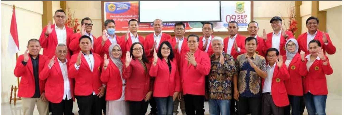
Suasana penyuluhan hukum untuk masyarakat Kecamatan Magersari.