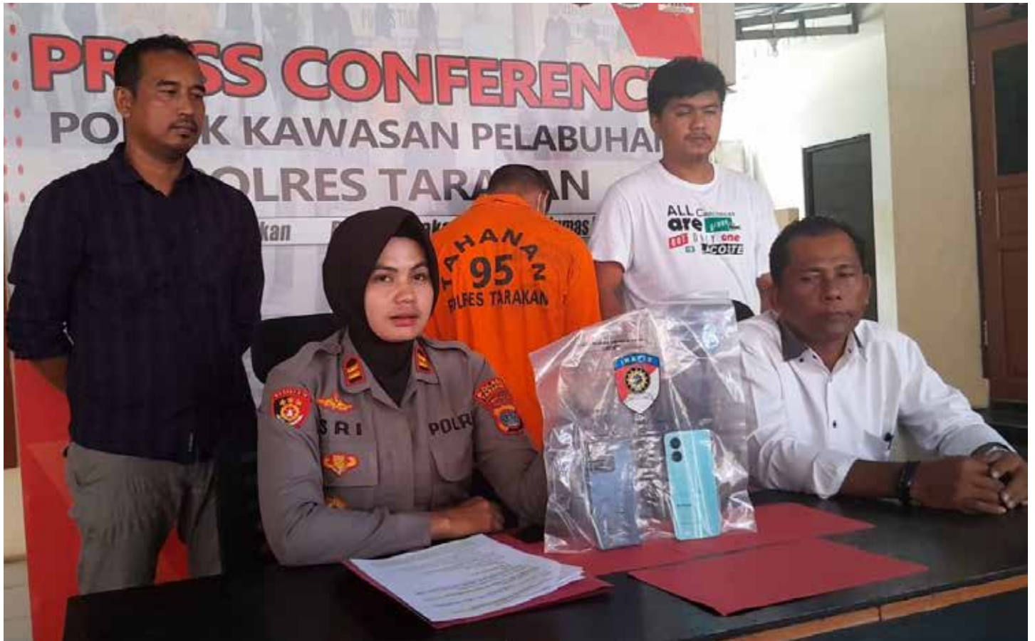
FH saat ditampilkan dalam press release Kepolisian Sektor Kawasan Pelabuhan (KSKP) Tarakan.