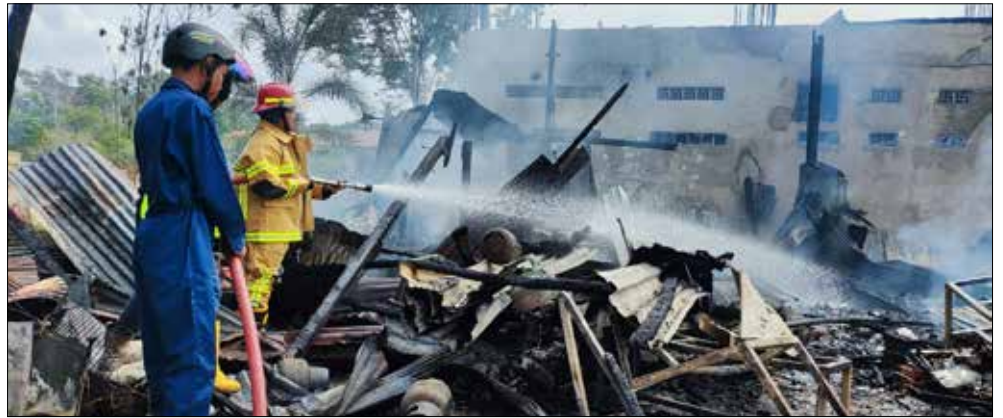
Kebakaran di RT 14 Kelurahan Sepinggán Baru hanguskan 2 bangunan tempat tinggal dan warung kopi.

Sejumlah wargayang menyaksikan kebakaran tersebut pun berusaha memadamkannya dengan apar dan alat-alat seadanya. "Nggak sanggup tadi yang madamkan pake alat tabung kecil itu. Pake air sama ember